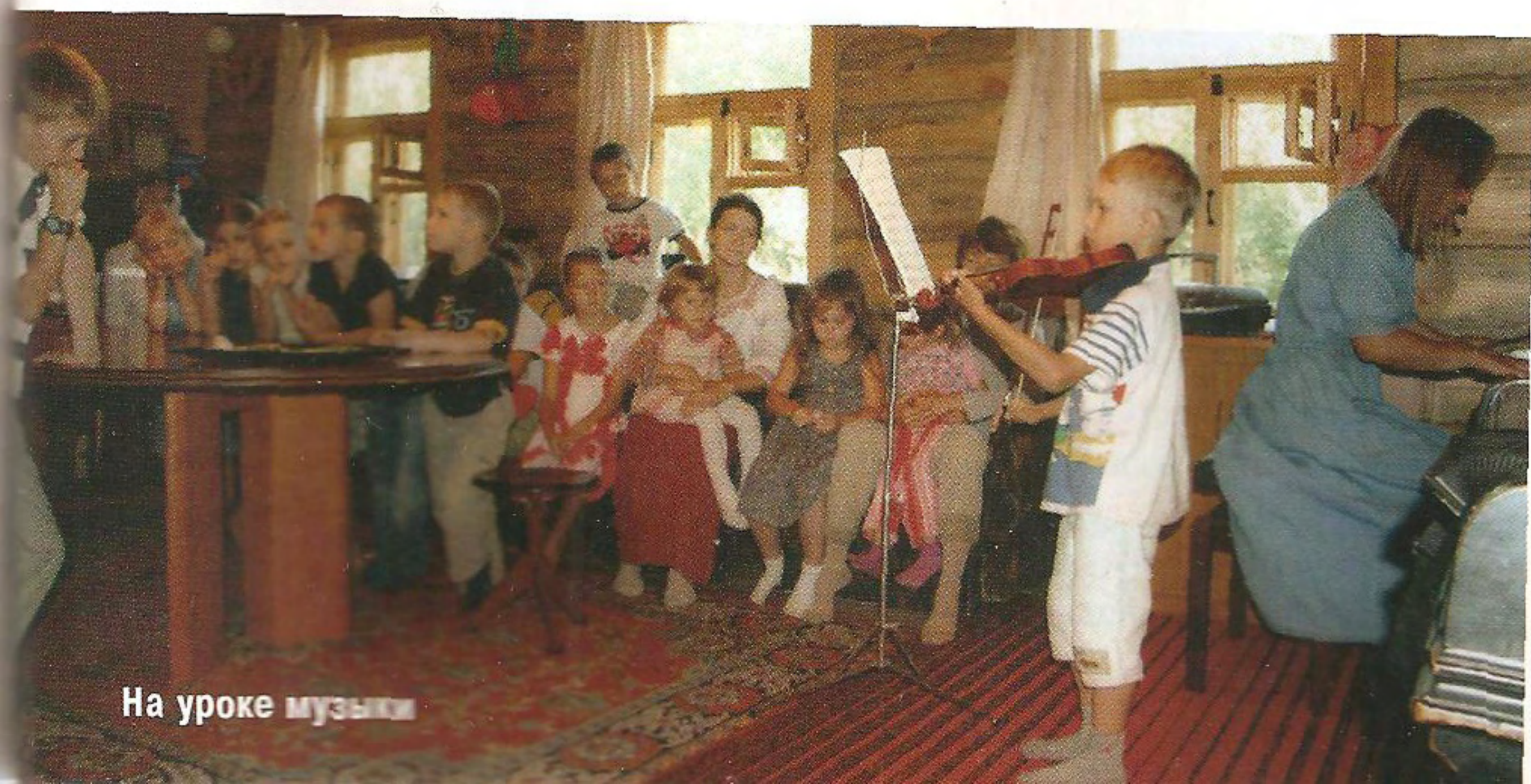
На уроке музыки

Оксана Глубоковская